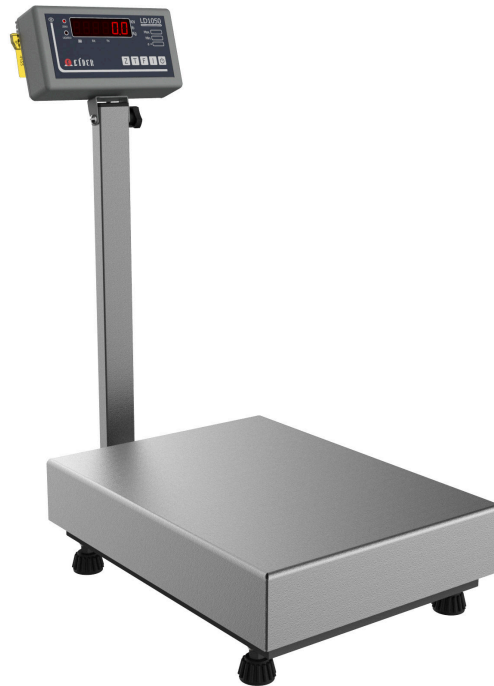
Série B180, balança de plataforma com indicador em ABS.